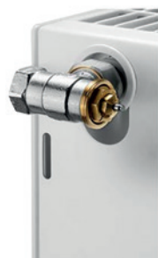
Gewindeanschluss an konventionellen Heizkörpern