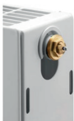
Gewindeanschluss an Ventilheizkörpern